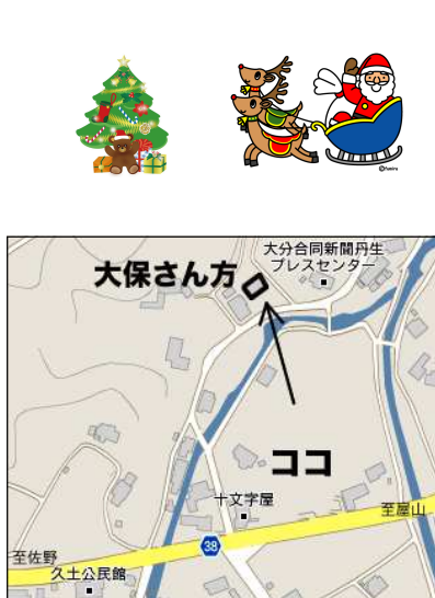
久土の大保さん方への道順